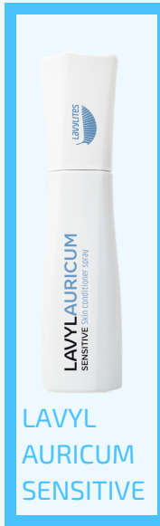
LAVYL AURICUM SENSITIVE

Präventiv und zur Unterstützung der Regeneration wird empfohlen, 2-3 mal täglich und mehrmals nach Bedarf, alle Stellen mit ca. 30 cm Abstand zur Haut, zu besprühen.